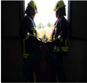
A DEUX sauveteurs avec point fixe structurel