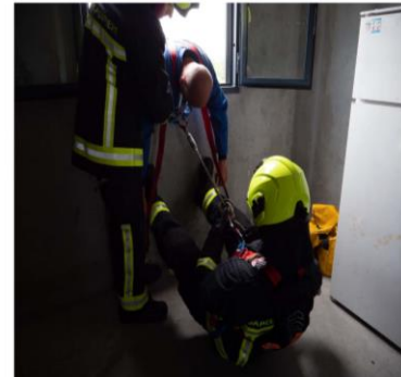
A UN sauveteur avec point fixe humain

Lors de la mise au vide, deux possibilités :